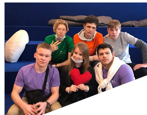
«Чтобы поверить в добро, надо начать делать его»