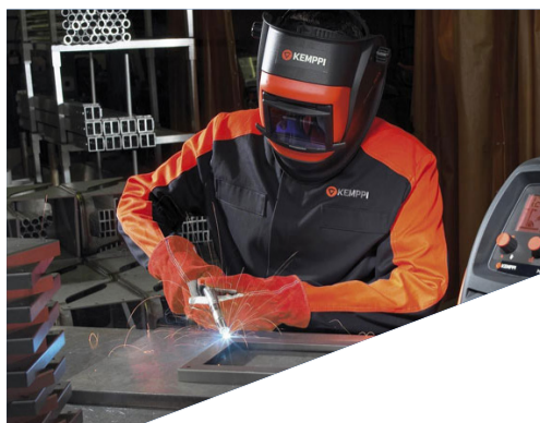
«ЦТС Выборг» - партнеры колледжа