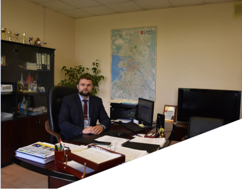
НАЧАЛО УЧЕБНОГО ГОДА 2 стр