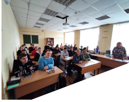
"ХЛЕБ БЛОКАДНОГО ЛЕНИНГРАДА" 2-3 стр