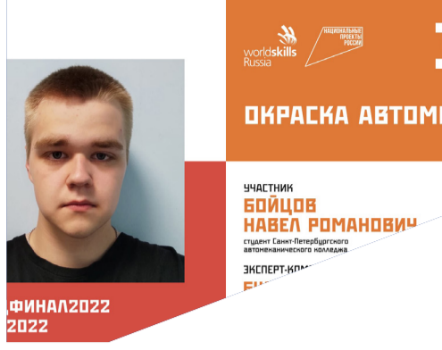
WORLDSKILLS RUSSIA 4 стр