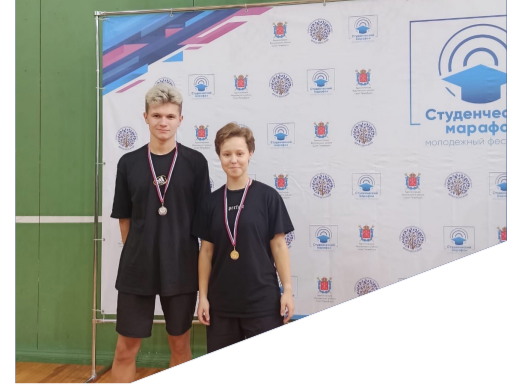
НОВОСТИ КОЛЛЕДЖА 5-6 стр